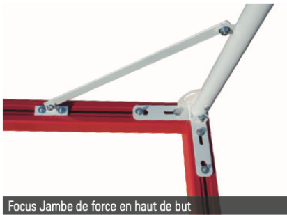
Focus Jambe de force en haut de but